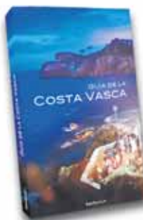
GUÍA DE LA COSTA VASCA Autora: Janire Arrondo 15,00 €

* Zure liburuarekin Basterretxearen lamina opari