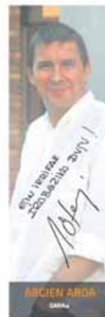
ARGIEN AROA EL TIEMPO DE LAS LUCES Egilea/Autor: Fermin Munarriz 15,00 €