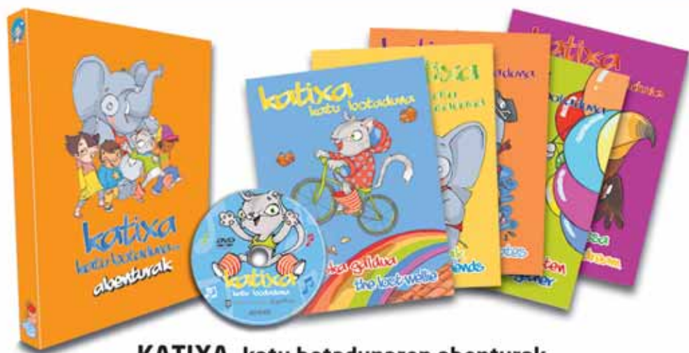
KATIXA, katu botadunaren abenturak Bilduma: 5 haur-ipu + DVDa + ipuinak gordetzeko karpeta 18,00 €