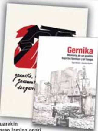
GERNIKA Memoria de un pueblo bajo las bombas y el fuego Autores: Ingo Niebel-Juanxo Egaña 15,00 €

* Zure liburuarekin Basterretxearen lamina opari